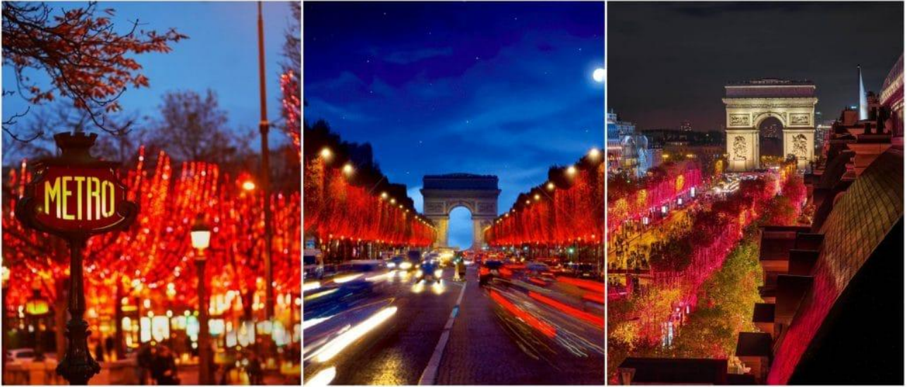
Avenue des Champs Élysées, Paris 8

Dimanche 24 novembre 2024, la plus belle avenue du monde s'est illuminée. Cette nouvelle édition, dans la continuité de celle de l'année dernière, promet une avenue des Champs-Élysées dorée et scintillante, avec une consommation d'énergie réduite, 100% LED, pour décorer ses arbres. Les illuminations de l'avenue débuteront en début de soirée vers 17h et s'éteindront à minuit, exception faite pour les 24 et 31 décembre où elles scintilleront toute la nuit.