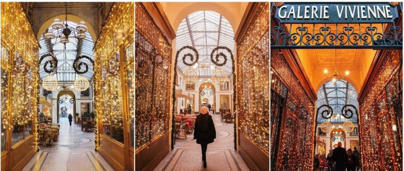
Galerie Vivienne, Paris 2